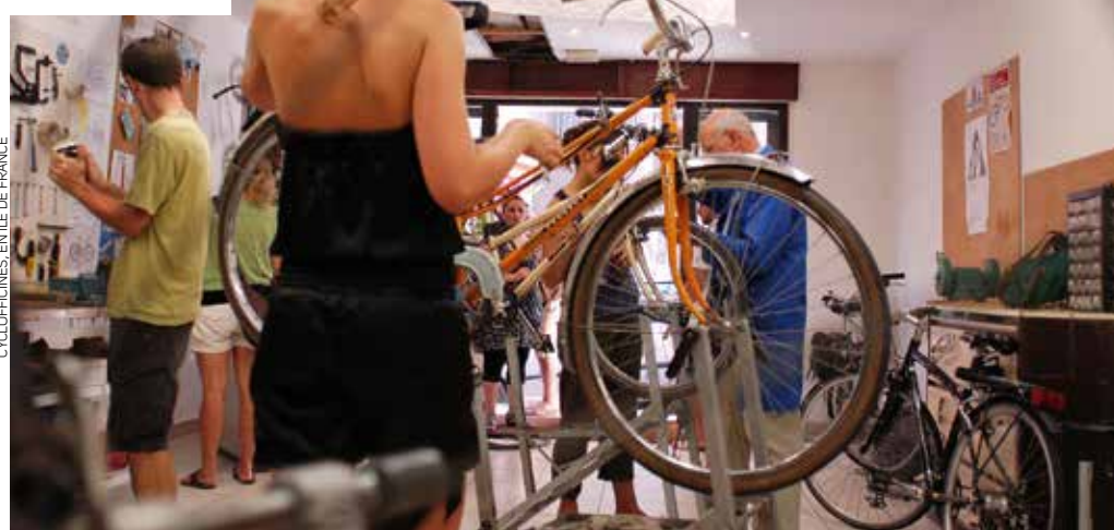
CYCLOFFICINES, ÎLE DE FRANCE

POUR UTILISER LES SERVICES de l'atelier participatif, pas besoin de savoir se servir de la clé de douze.